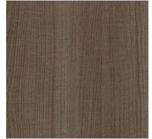
Kapučino ažuolas (LMDF)

Išsamesnes informacijos, bei pavyzdžių teiraukitės mūsų regionų vadybininkų :