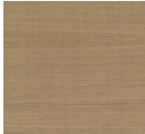
Natūralus ažuolas (faner.)