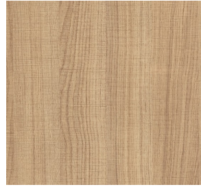
Natūralus ažuolas (LMDF)